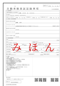
自動車検査証記録事項